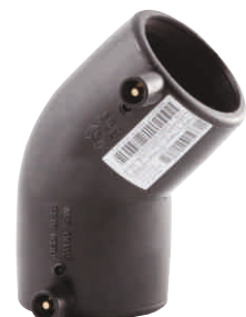
Electro-fusion Elbow Ηλεκτρογωνία 45°