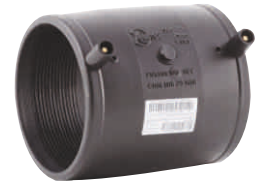
Electro-fusion Socket Ηλεκτρομούφα