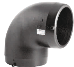
Electro-fusion Elbow Ηλεκτρογωνία 90°