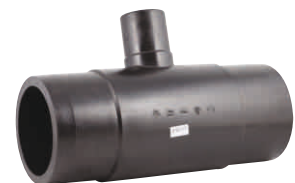
Reducing Tee Συστολικό Τάφ