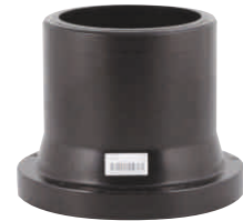
Stub Flange Λαιμός Φλάντζας