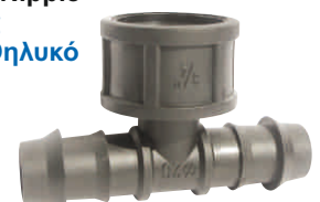
Tee Indented Female Nipple Ταφ Φις Νίτελ Θηλυκό