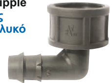
Elbow Indented Female Nipple Γωνία Φις Νίτελ Θηλυκό