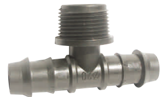
Tee Indented Male Nipple Ταφ Φις Νίτελ Αρσενικό