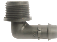
Elbow Indented Male Nipple Γωνία Φις Νίτελ Αρσενικό