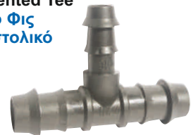
Reducing Indented Tee Ταφ Φις Συστολικό