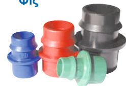
Grip Ring Φις