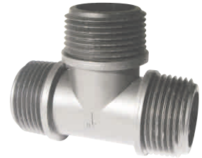
Tee Threaded Male Σώμα Ταφ Αρσενικό