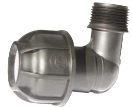
Elbow Male Thread Γωνία Ρακόρ Αρσενικό