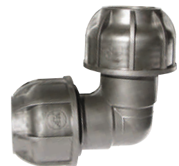
Elbow Quick Coupling Γωνία Σύνδεσμος Ρακόρ