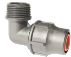
Elbow Male Threaded Γωνία Αρσενική Ρακόρ