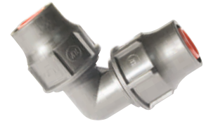
Elbow Quick Coupling Γωνία Σύνδεσμος Ρακόρ