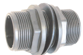
Tank Adaptor (With Single Elastometric Ring) Παροχή Δεξαμενής (Με Μονή Φλάντζα)