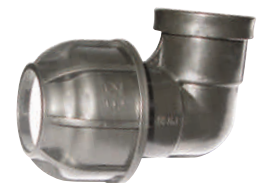
Elbow Female Thread Γωνία Ρακόρ Θηλυκό

*With reinforcing ring - Με μεταλλικό δακτυλίδι