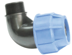
Elbow Male Threaded Γωνία Ρακόρ Αρσενικό