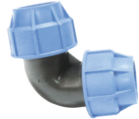
Elbow Quick Coupling Γωνία Σύνδεσμος Ρακόρ