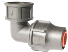
Elbow Female Threaded Γωνία Θηλυκή Ρακόρ