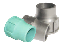
Coupling Nut Περικόχλιο