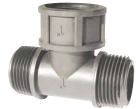
Tee Threaded (Male - Female - Male) Σώμα Ταφ (Αρσενικό-Θηλυκό- Αρσενικό)